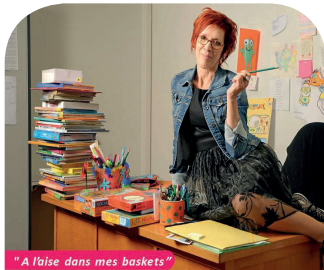
"A l'aise dans mes baskets"

Une exposition appelée «TOUT EST POSSIBLE», prêtée par la SAMETH et CAPEMPLOI, a été affichée au siège et en agences. Le but était d'offrir un autre regard sur le handicap au travail afin de favoriser à la fois le recrutement de salariés porteurs de handicap et le maintien dans l'emploi de ces personnes.